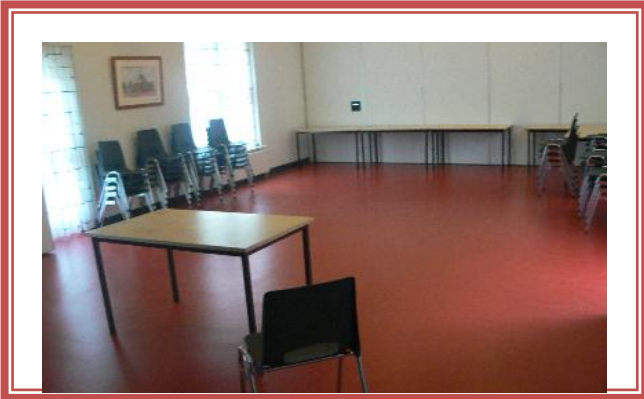
Bijzaal met stoelen en tafels