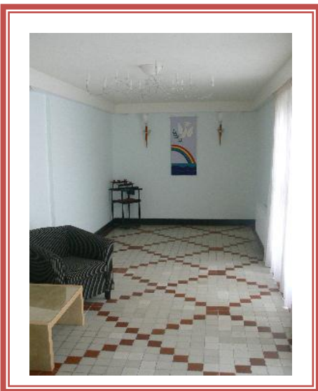
Opbaarruimte vanaf de