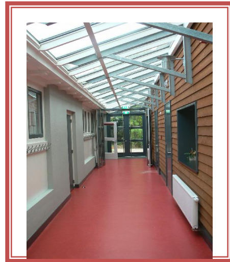
Ruime entreehal Gang met garderobe