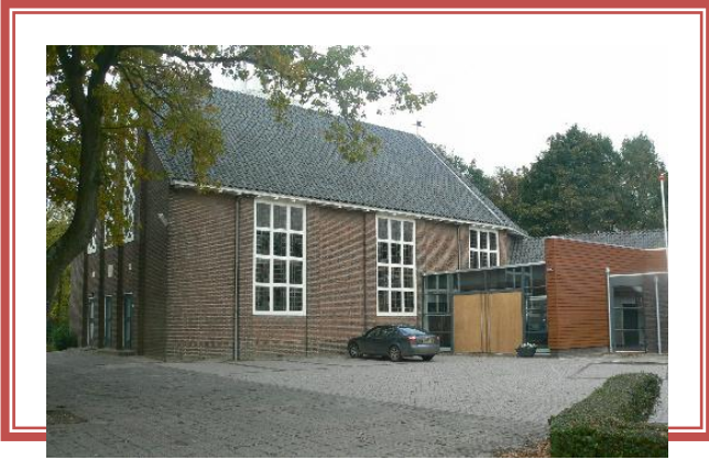
Kerkgebouw en bijzalen vanaf het plein